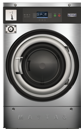
MYR**PD / MYS**PD